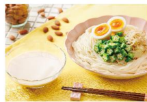
アーモンドミルクのコクで減塩!! アーモンドミルクめんつゆ★そうめん

アーモンドミルクは加熱しても、栄養が変わりにくく、牛乳や豆乳のように膜が張りません。また、アーモンドの風味は、和洋中やエスニックなど、どんな料理にも意外と合うので、冷たいデザートから熱々の鍋物まで、手軽に料理に取り入れることができます。さらに、アーモンドミルクを料理に使うことで、コクが出て、簡単にワンランク上の一品を作ることができます。